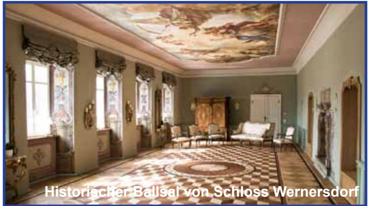
Historischer Ballsaal von Schloss Wernersdorf